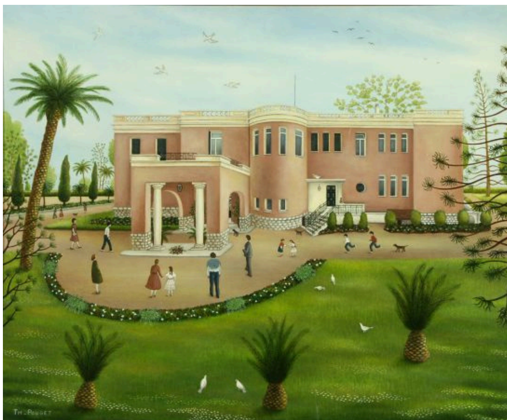
Le Musée International d'Art Naïf 1986 Acrylique sur toile Collection Ville de Nice - Musée International d'Art Naïf Anatole Jakovsky

Cette peinture est explicitement décrite comme un hommage au musée, et constitue l'un des exemples les plus clairs de cette tradition.